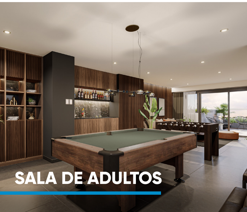
SALA DE ADULTOS