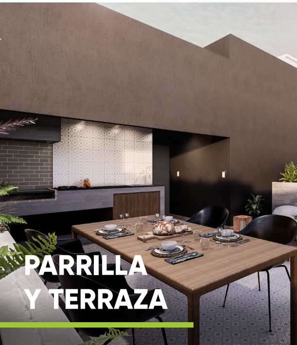
PARRILLA Y TERRAZA